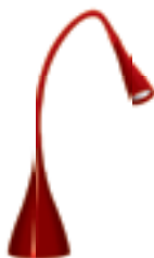
CLARISA 6LED SMD KT-R