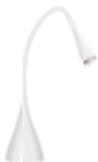
CLARISA 6LED SMD KT-W