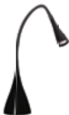
CLARISA 6LED SMD KT-B